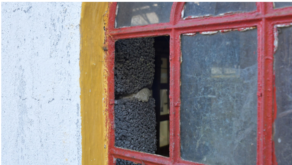
GAVL MOD VEJEN

Vi har således efter en besigtigelse ingen yderligere bemærkninger til de i ansøgningen anførte forhold om bygningens meget ringe tilstand. Vi kan kun beklage, at det på grund af mange års manglende vedligehold må anses for nødvendigt at nedrive denne oprindeligt meget fine og enkle staldbygning.