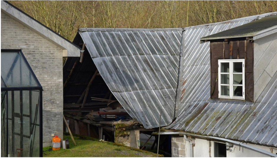
STALDEN OG STUEHUSET

Der vil efter en nedrivning af stalden ikke være meget tilbage af stedets autenticitet. BLIS skal i den forbindelse ikke undlade at gøre opmærksom på, at den nye værkstedsbygning, der er opført efter at den bevaringsværdige lade blev nedrevet i 2006, efter BLIS' opfattelse på alle måder fremstår som et groft ufølsomt indgreb i stedets kulturhistoriske kontekst.